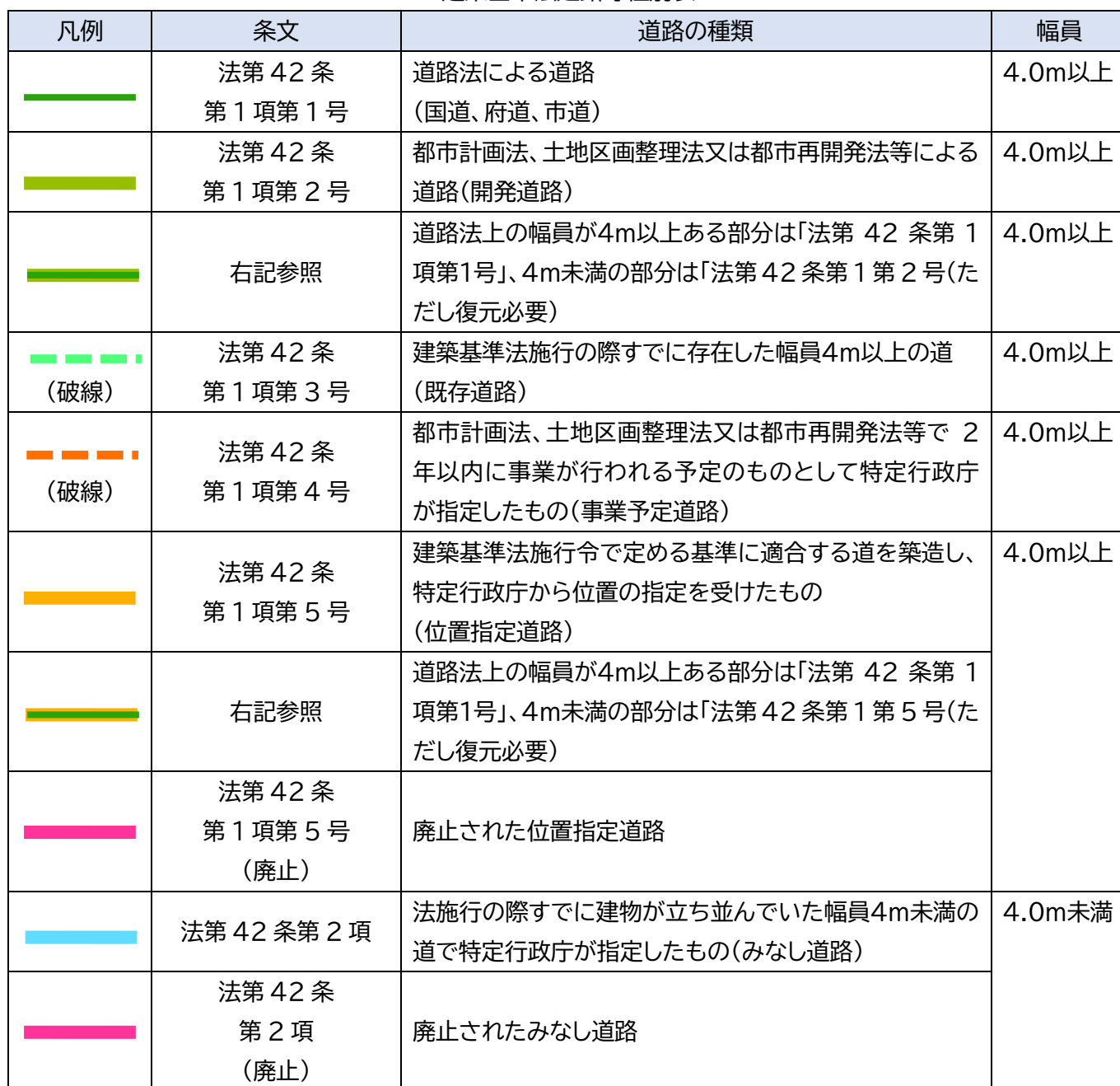
建築基準法道路等種別表

本サイトは建築基準法上の道路等の種別を表示します。 あくまでも参考図であり、利用者の責任と判断でご利用ください。